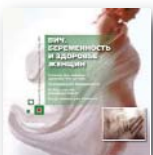
ВИЧ, беременность и здоровье женщин 2008

В подготовке публикации приняли участие эксперты Федерального научно-методического центра по профилактике и борьбе со СПИДом, независимые эксперты и рецензенты из числа людей, живущих с ВИЧ. Публикация выпущена в рамках программы Фонда развития МСП/РОО «Сообщество ЛЖВ» «Расширение доступа к лечению социально значимых заболеваний».