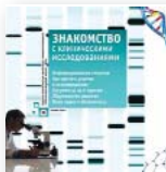
Знакомство с клиническими исследованиями 2008

Брошюра разъясняет вопросы участия в клинических (биомедицинских) исследованиях для пациентов и, в частности, людей, живущих с ВИЧ. Появление новых антиретровирусных препаратов и методов лечения невозможно без проведения клинических исследований с участием человека и часто пациентам в клиниках предлагается принять участие в таких исследованиях. Чтобы помочь пациентам понять, что такое клинические исследования, зачем они нужны, как проводятся и как участникам защитить свои интересы и права, в данной публикации рассматриваются такие ключевые вопросы как фазы и типы исследований, информированное согласие, права участников, факторы, влияющие на принятие решения об участии в исследованиях.