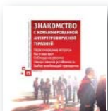
Знакомство с комбинированной антиретровирусной терапией 2е издание 2008

В подготовке публикации приняли участие эксперты Федерального научно-методического центра по профилактике и борьбе со СПИДом и Национального агентства клинической фармакологии и фармации.