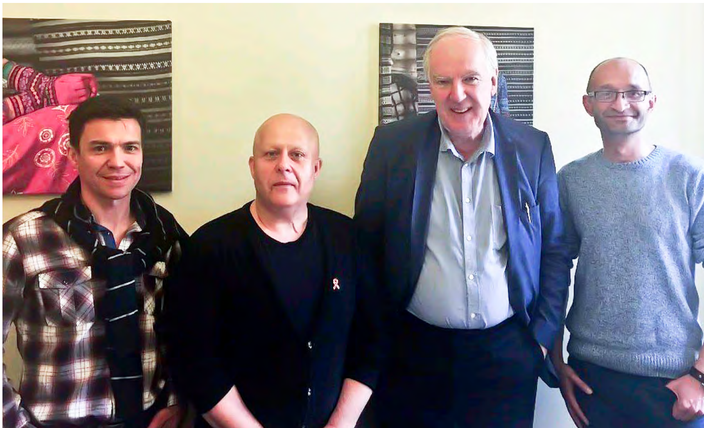
13 июня – Встреча представителей Эстонского Консорциума с послом королевства Швеции

Välisesindused kinnitasid, et Eestis on vajalik aktiivsem HIV ennetustöö, parem selgitus ravi osas ning inimeste osas, kellel on HIV. Eestil