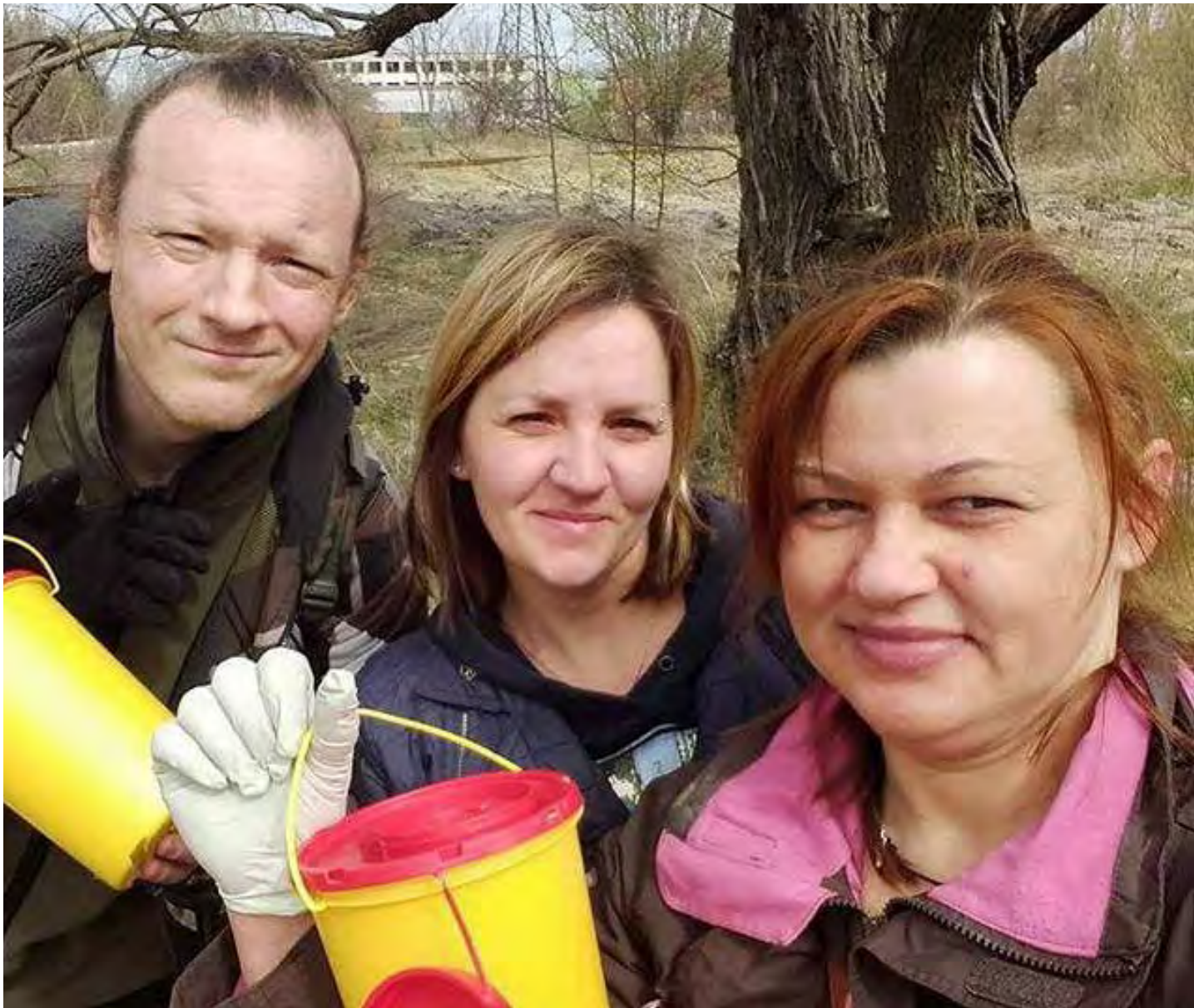
6. mai talgud „Teeme ära!“, Lunest

Kohtla-Järvel ja Tallinnas läksid tänavale, et puhastada oma kodulinna kasutatud süstaldest ja muust prahist. Kõik töötasid usinalt vabas õhus, tehes tööd ühiskonna heaks. Ürituse eesmärgiks oli kannustada ühingu liikmeid ning näidata, et ühing on valmis andma ühiskonnale saadu eest ka midagi tagasi. Rõõmustavaks oli talgute korraldajate ja võimude suhtumine – ühingu tegevust toetati ning me ei tundnud kordagi võõristavat tunnet, millega oleme nii tihti kokku puutunud.