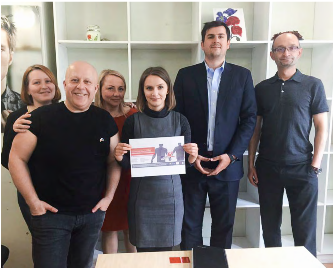
17. mai kohtumine Ameerika Ühendriikide Saatkonna esindajatega