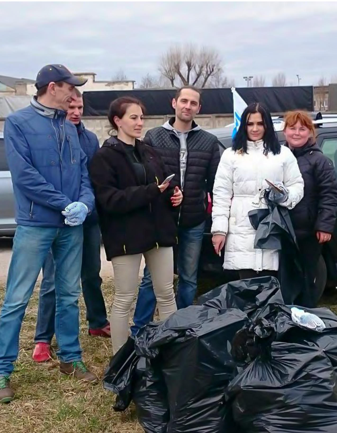
6. mai talgud, Lunest Narva