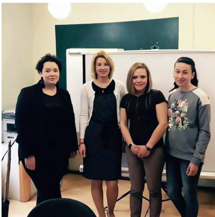
8. juuni kohtumine Kanada Suursaatkonna esindajatega

mille käigus me rääkisime oma tulevikuplaanidest, koostöövõimalustest ja koostegutsemise võimalustest.